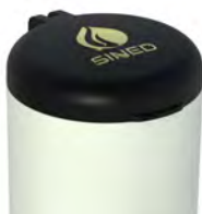
FONTANA-TRITONE-PRO- BIANCA 8025431017931