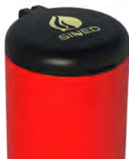
FONTANA-TRITONE-PRO- ROSSA 8025431018099