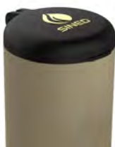
FONTANA-TRITONE-PRO- TORTORA 8025431018105