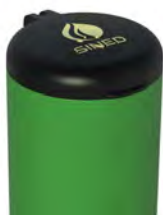
FONTANA-TRITONE-PRO- VERDE 8025431018112