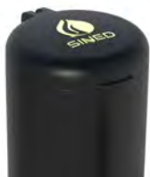
FONTANA-TRITONE-PRO- NERA 8025431018082